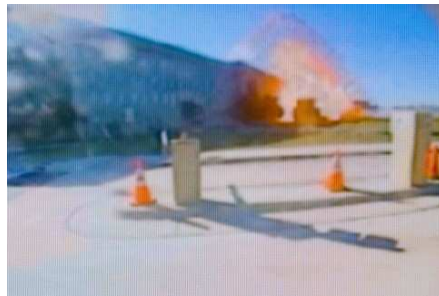
34 Minuten nachdem das zweite Flugzeug den Südturm getroffen hat, zerschellt American Airlines Flug 77 im Westteil des Pentagon.