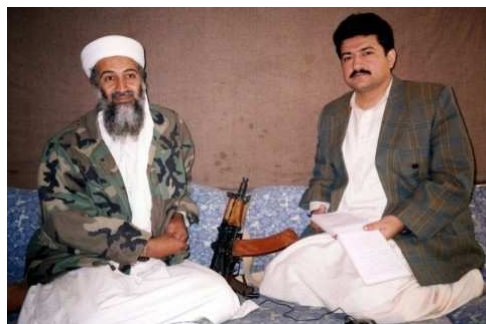
Rar waren stets die Gelegenheiten für Journalisten, mit Bin Laden zu sprechen. Hier gibt er im November 2001 dem Pakistani Hamid Mir, dem Herausgeber der Tageszeitung "Daily Ausaf", ein Interview.