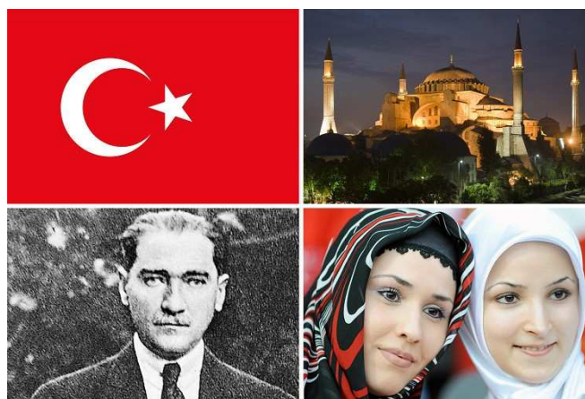
Der türkische EU-Kandidat: Hagia Sophia (o.r.), Staatsgründer Atatürk, junge Frauen mit Kopftuch

Übrigens ist es aus diesem Grund auch strategisch so wichtig, der Türkei den Weg in die Europäische Union offen zu halten. Die Türkei Atatürks steht für moderaten, demokratischen, Religion und Staat trennenden Islam. Deshalb ist es so wichtig, sie – unabhängig von