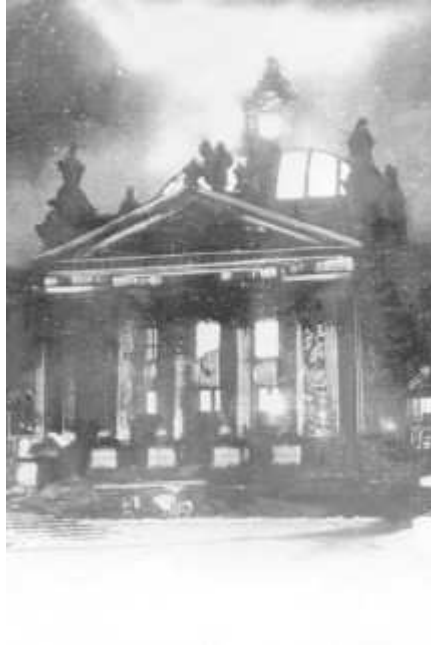
Wer das Feuer legte, ist seitdem umstritten.