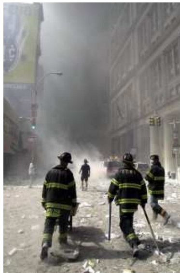
Rettungshelfer kämpfen sich nach dem Einsturz der brennenden Zwillingtürme zum Unglücksort durch.