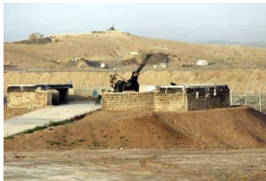
Die Atomanlage in Natans ist von einem militärischen Abwehrring umgeben.