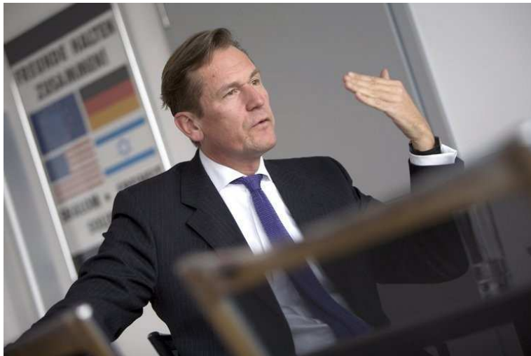
Mathias Döpfner, 47, ist Vorstandsvorsitzender der Axel Springer AG

Nun erhebt die Justiz in Täbris öffentlich Spionage-Vorwürfe. Ein absurder und gefährlicher Vorwurf. Auf Spionage steht im Iran im Extremfall die Todesstrafe.