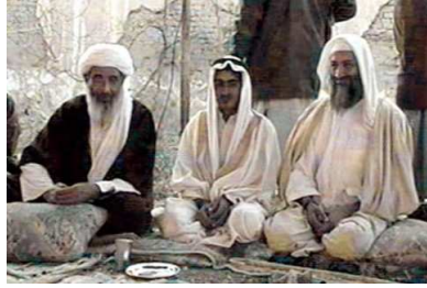
Großfamilie: Bin Laden (r.) soll das 17. Kind eines saudischen Ölbarons sein und hat auch selbst eine große Kinderschar. Hier heiratet sein Sohn Mohammed (M.) die Tochter eines Vertrauten seines Vaters.