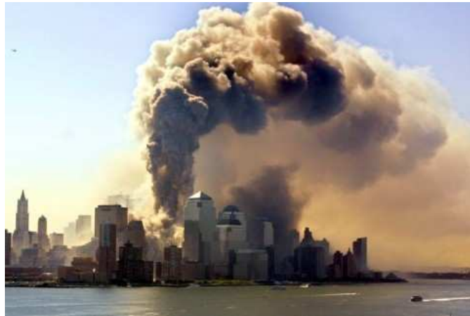
... und bieten den Zuschauern auf der anderen Seite des Hudson ein erschreckendes Bild.