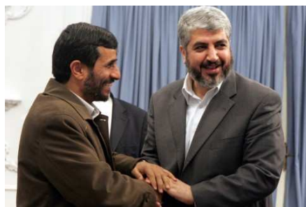
Verbündete: Ahmadinedschad mit Hamas-Führer Chaled Meschal.