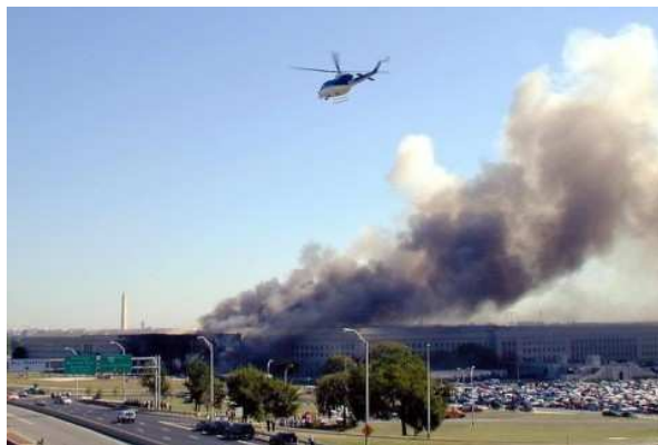
Von der südwestlichen Ecke des Pentagon steigt Rauch auf.