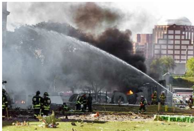
Rettungshelfer löschen die Brände.