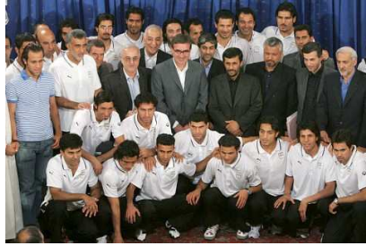
Mit der iranischen Fußball-Nationalelf vor der Fußball-WM 2006: Ahmadinedschad gilt als großer Fußball-Fan.