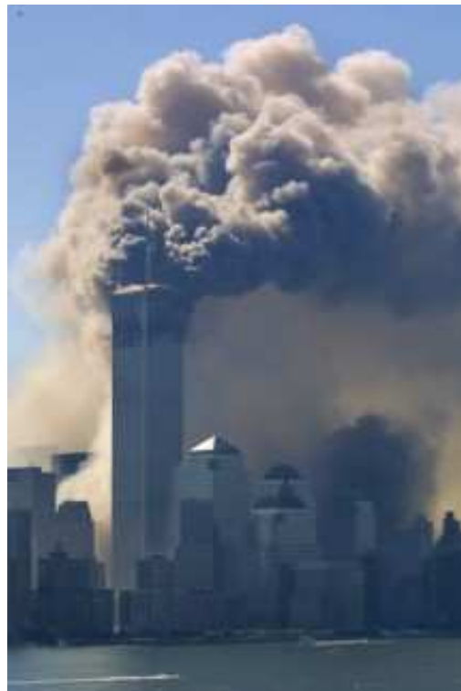
Die schwarze Rauchsäule über den Zwillingstürmen war weithin zu sehen.