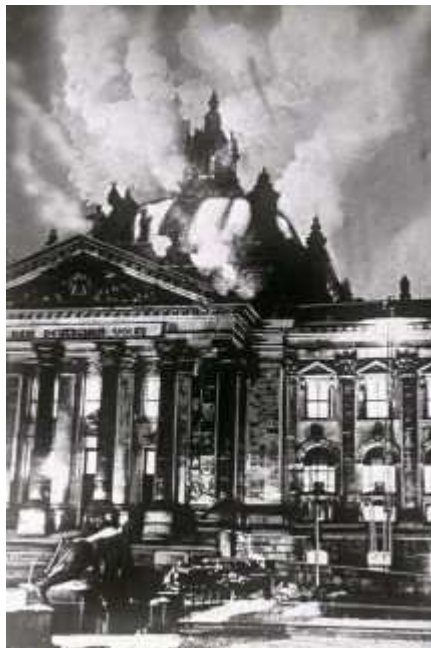
Bis heute gibt es Forscher, die die Nazis als Täter vermuten.