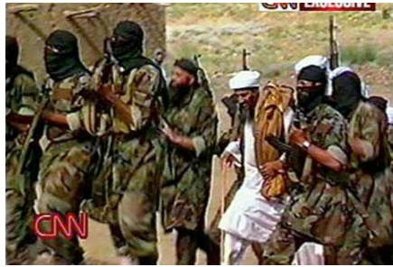
Großer Auftritt: Immer wieder präsentiert sich Bin Laden von Leibwächtern umringt. Den USA gelang es trotz Großfahndung und der Aussetzung von Kopfgeldern bisher nicht, den Terror-Chef zu fassen.