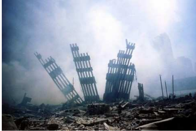
World Trade Center übrig blieb.