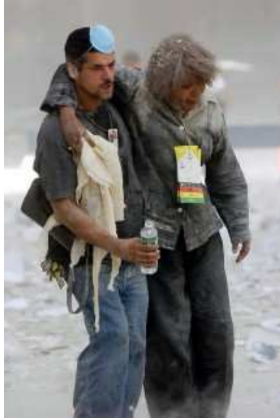
Ein Mann hilft einer Frau aus den Trümmern des eingestürzten World Trade Centers.