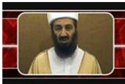
Hier ist er Bin Laden einer seiner zahlreichen Videobotschaften zu sehen.

Über dieses schemenhafte Foto wurde im Jahr 2009 diskutiert. Ist auf dem Bild Bin Laden zu sehen - oder nicht?