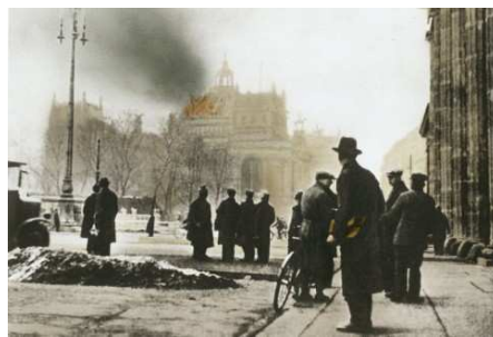
... Flammen und Brandrauch hinein. In dieser verfälschten Form ist das Bild in vielen Büchern zu finden.