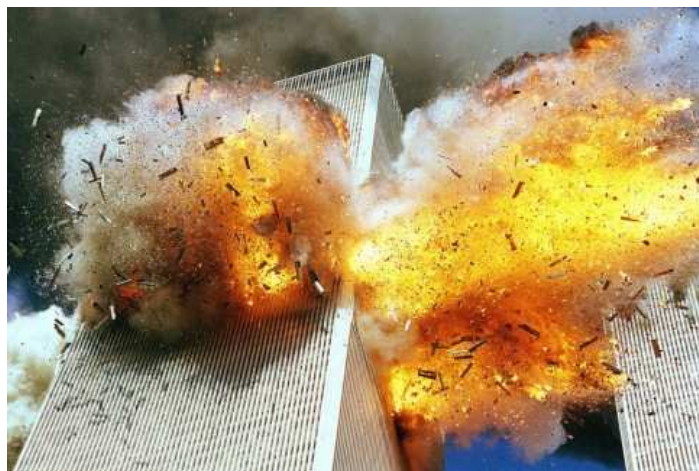
Foto: Landov ... World Trade Centers in New York gingen um die Welt.