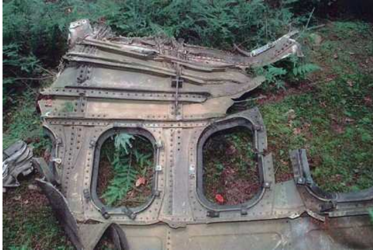
Ein Wrackteil der Maschine von Flug 93 in Pennsylvania.