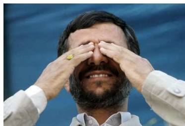
Vor der internationalen Kritik an seiner Politik verschließt der iranische Präsident gern die Augen.