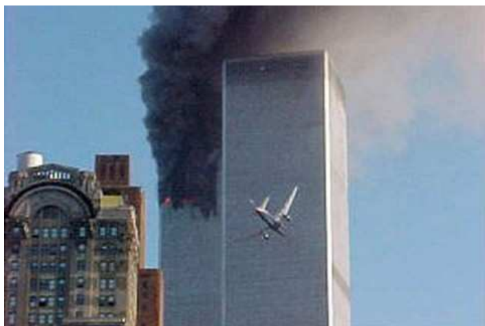
Fast 3000 Menschen wurden getötet.