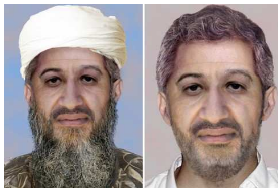
...könnte heute ganz anders aussehen: In einer Computersimulation hat das FBI genau wegen dieser Problematik zwei Fotosimulationen entwickelt.