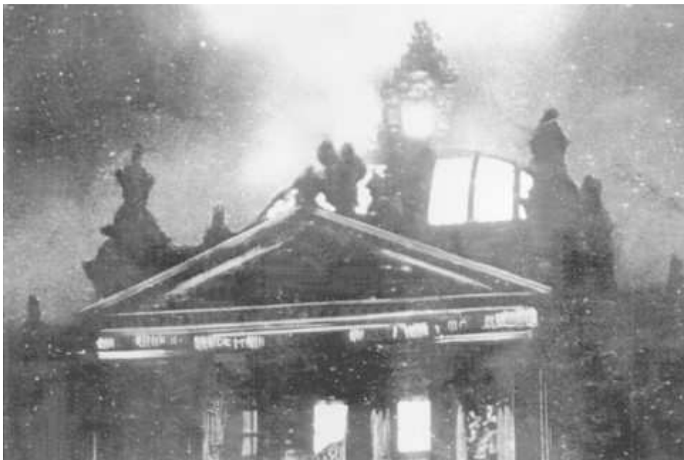
Der brennende Reichstag in der Nacht des 27. Februar 1933. Die Nationalsozialisten nutzten den Brand sofort politisch aus.