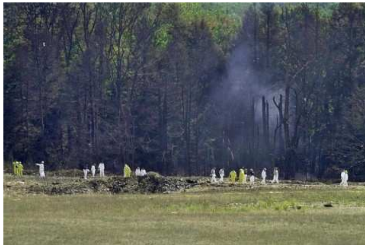
Foto: AFPI Die vierte Maschine erreichte nie ihr Ziel: Offenbar nach einem Kampf im Cockpit stürzte sie bei Pittsburgh (US-Bundesstaat Pennsylvania) auf freiem Feld ab. Die Terroristen wollten vermutlich in das Weiße Haus fliegen.