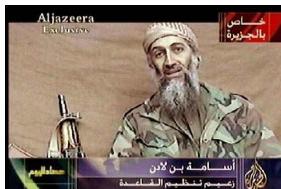
In der Vergangenheit war das sein typisches Auftreten: Bin Laden zeigt sich in einem seiner Videos in Kampfuniform mit Turban und Kalaschnikow. Den USA gilt Bin Laden als Drahtzieher der Terroranschläge vom 11. September. Experten bezweifeln allerdings immer wieder, dass er bei al-Qaida noch eine führende Rolle spielt.

Hier ist er Bin Laden einer seiner zahlreichen Videobotschaften zu sehen.