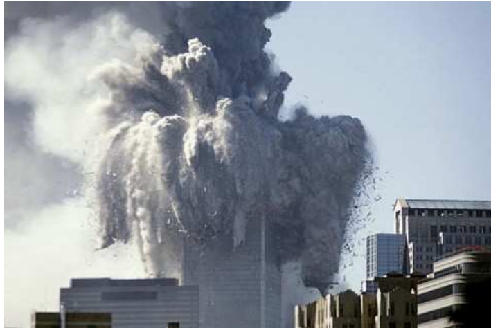
Wenig später kollabiert der zweite.