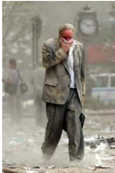
Ein anderer hält sich als Schutz vor dem beißenden Rauch ein Tuch vor den Mund.