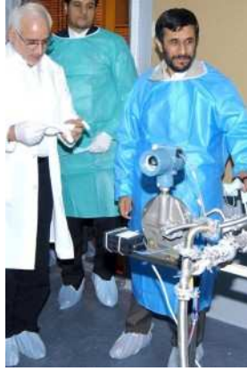
In der Uran-Anreicherungsanlage Natans: Der Iran ist nach den Worten Ahmadinedschads jetzt in der Lage, sich selbst mit Atombrennstoff für Kernkraftwerke zu versorgen.