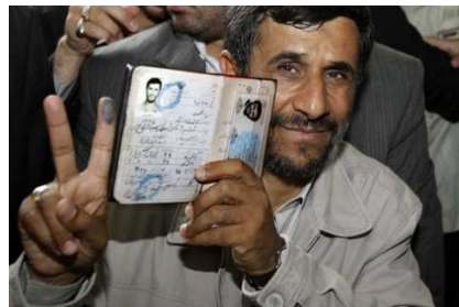
Mahmud Ahmadinedschad ist seit dem 3. August 2005 der sechste Präsident der Islamischen Republik Iran.

Die Diktatoren der Geschichte, allen voran Hitler, Mao und Stalin, haben Massenmord, die Durchsetzung ihrer Ideologie ohne Rücksicht auf Verluste, in ähnlicher Weise angekündigt, wie es Ahmadinedschad oder Osama bin Laden heute tun. Wie bei Mao oder Stalin ist ihr Ziel, die Welt besenrein zu machen für den Einzug des fundamentalistischen Islam.