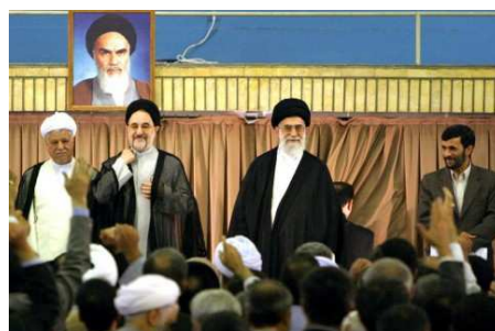
Bevor er 2005 erstmals zum Staatsoberhaupt gewählt wurde, war Ahmadinedschad (r.) Bürgermeister von Teheran (r.).

Das Foto zeigt ihn bei seiner Wiederwahl im Juni 2009.