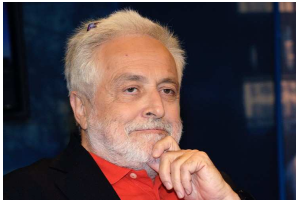
Henryk M. Broder

Ob an deutschen Schulen oder an den internationalen Konfliktfronten – der Westen (mit Ausnahme Amerikas) organisiert artig seine kulturelle und machtpolitische Selbstaufgabe – und da, wo er es mal nicht tut ist schnell der Vorwurf des Hegemonialstrebens oder der Intoleranz gegenüber dem Andersartigen zur Hand. Und wenn dann doch mal jemand gegen die Sprachregelungen der „political correctness“ aufbegehrt, dann wird man schnell in die Zonen der intellektuellen Wütereie verbannt, aus der es im aufgeklärten, feinsinnigen intellektuellen Diskurs kaum noch ein entrinnen gibt.