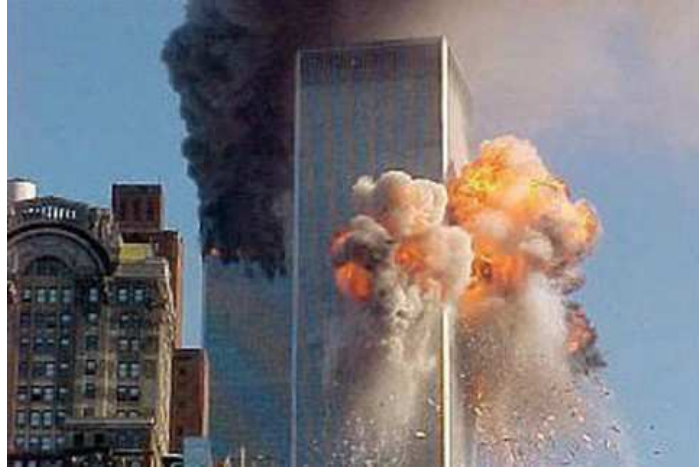
Die Bilder der einstürzenden Türme des...