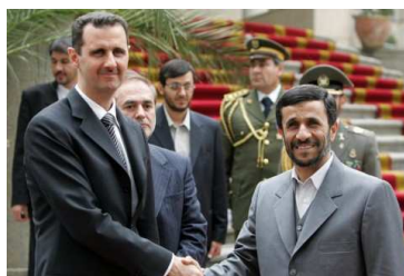
Verbündete: Ahmadinedschad mit dem syrischen Präsidenten Bashar al-Assad.