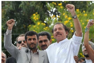
Verbündete: Ahmadinedschad und Nicaraguas Präsident Daniel Ortega.

Anmerkung Mittelstand: Spätestens mit den letzten beiden Bildern und dem nachfolgenden wird die weltweite Kooperation zwischen Komintern und Islam deutlich! Wer von beiden Lügensystemen siegt am Ende ?