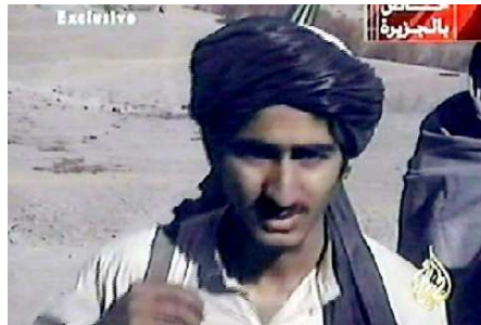
Ganz der Vater: Auch Bin-Laden-Sohn Mohammed zeigt sich gern schwer bewaffnet.