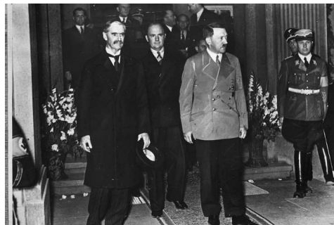
1938: Besprechung des englischen Premierministers Chamberlain mit Hitler in Godesberg

In diesem Sinne bleibt er einer der wenigen entschiedenen Kritiker des europäischen Appeasements: „Das Ringen mit den Islamisten ist weder verloren noch gewonnen. Wir haben überlebt, weil die Feinde noch größere Fehler als wir gemacht haben... Das ist die Erfahrung meiner Generation, die das Beugen vor der Terrorgefahr mit der Politik der Beschwichtigung, Appeasement, des damaligen britischen Premiers Chamberlain und dem Münchner Abkommen verbindet. Zwar leben wir in einer anderen Zeit. Doch sind die Grundprinzipien des menschlichen Benehmens gleich: Schwäche und Furcht ermutigen den Gegner.“