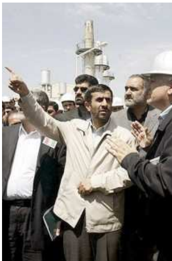
Der Präsident bei der Einweihung einer Schwermwasseranlage in Arak: Ahmadinedschads Atomprogramm wird international als Bedrohung angesehen.