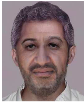
Foto: AFP Das zweite Bild zeigt Bin Laden mit einem Kurzhaarschnitt und gestutztem Bart.

Foto: AFP Diese Variante sieht Bin Laden noch sehr ähnlich. Sein Bart dominiert das Bild.