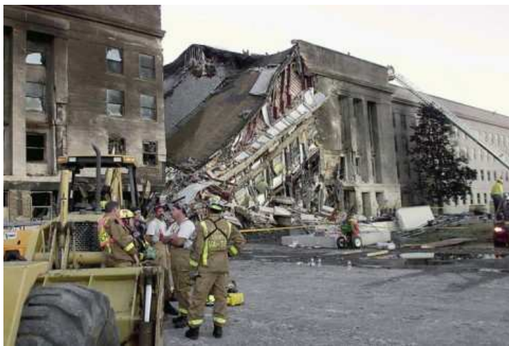
189 Menschen kommen alleine hier ums Leben.