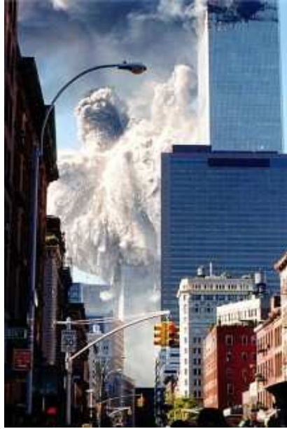
Der Moment des Kollaps' des ersten Turms.