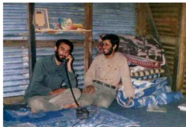
Ein undatiertes Foto aus Studententagen.