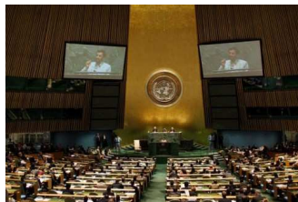
Im September 2006 verteidigte Ahmadinedschad seine Atompläne vor der UN-Vollversammlung in New York.