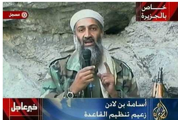
Immer wieder meldet sich Al-Qaida-Chef Osama Bin Laden zu Wort - allerdings nicht, wie früher, per Video, sondern lediglich in Tonbandaufnahmen. Ob er noch so aussieht wie auf diesem Screenshot aus dem Jahr 2001, ist deshalb nicht klar. Der Islamist...