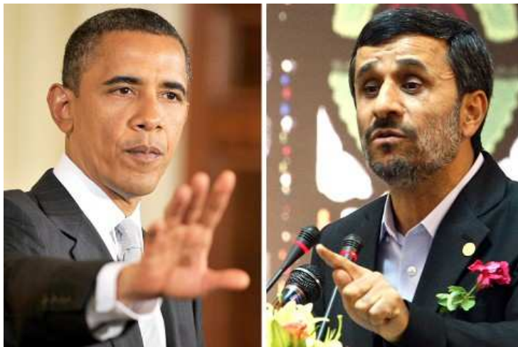
2010: Der iranische Präsident schlägt seinem US-Kollegen Obama zum zweiten Mal einen Dialog "von Mann zu Mann" über "die Fragen der Welt" im TV vor . Wegen des iranischen Atomprogramms ...