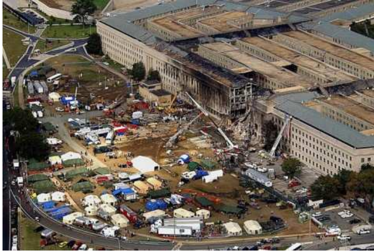
Die Westseite des Pentagon wird extrem beschädigt.