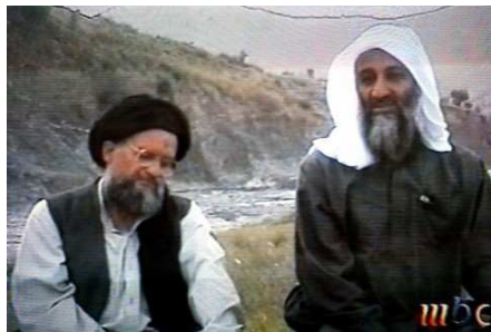
Die rechte Hand: Bin Laden (r.) mit seinem Stellvertreter Aiman al-Sawahiri. Auch er meldet sich immer wieder mit Videobotschaften zu Wort.