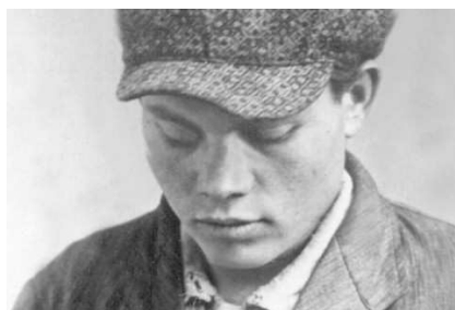
Der Niederländer Marinus van der Lubbe wurde als Täter verhaftet und 1934 hingerichtet. Viele Historiker halten es mit Hans Mommsen für sicher, dass er das Feuer gelegt hat. Das Urteil gegen ihn wurde im Januar 2008 aufgehoben.

Die Organisation „Freedom House“ misst Jahr für Jahr die Freiheit. Ein Rückgang der Freiheit wird in der jüngsten Erhebung in 40 Ländern festgestellt, was 20 Prozent der Nationen der Welt entspricht. In 22, also mehr als der Hälfte, wurden die Freiheitseinschränkungen als gravierend eingestuft. Die Zahl der bisher mit freien Wahlen ausgestatteten Demokratien fiel von 119 auf 116. Insgesamt wurden im Jahr 2009 89 Länder als „frei“ klassifiziert, das sind rund drei Milliarden Menschen und 46 Prozent der Weltbevölkerung.