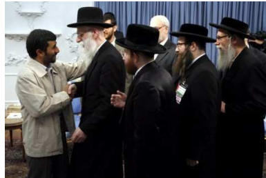
Um dies "wissenschaftlich" zu untermauern, rief er zu einer "Holocaust-Konferenz" nach Teheran.