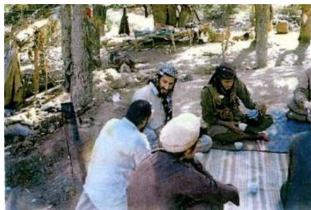
Picknick im Wald: Experten versuchten, aus den Videos Hinweise auf Bin Ladens Aufenthaltsort zu lesen - bisher ohne Erfolg.