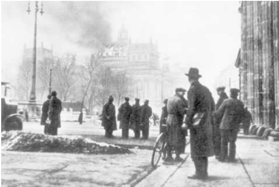
Dieses Bild vom Morgen des 28. Februar 1933 war einer Bildagentur zu unspektakulär, deshalb fügte ein Retuscheur ...