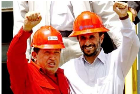
Sie vereint der Hass auf Amerika: Ahmadinedschad mit Venezuelas Präsident Hugo Chavez.

Anmerkung Mittelstand: Spätestens mit den letzten beiden Bildern und dem nachfolgenden wird die weltweite Kooperation zwischen Komintern und Islam deutlich! Wer von beiden Lügensystemen siegt am Ende ?