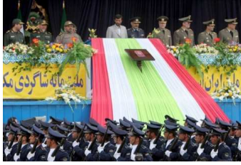
Im Kreise der Militärs lässt er sich gern fotografieren - wie bei dieser Militärparade in Teheran.