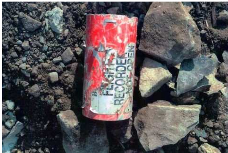
Der Flugschreiber des abgestürzten Flugzeugs. Mit seiner Hilfe konnten die letzten Stunden des Flugs 93 später rekonstruiert werden.

Den Terroristen der al-Qaida war ein beispielloser Erfolg gelungen. Am späten Nachmittag des 11. September 2001 war die Leitmacht des freien Westens an den drei wichtigsten Symbolorten ihrer wirtschaftlichen, militärischen und politischen Macht angegriffen und an den ersten beiden davon getroffen, mit dem World Trade Center sogar vernichtend getroffen worden.