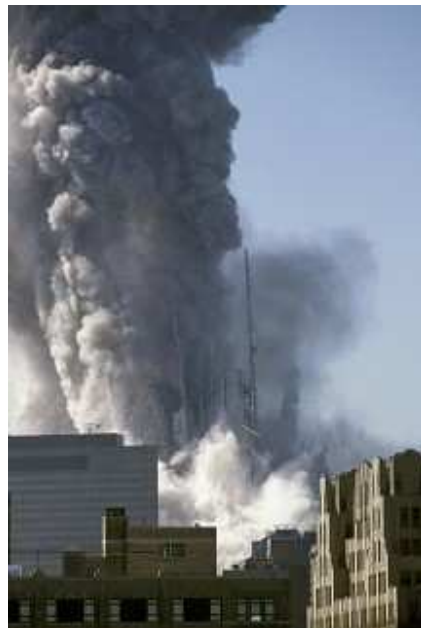
Riesige Rauchwolken entstehen...