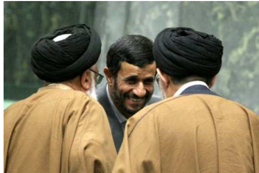
Steht stark unter dem Einfluss des Klerus: Ahmadinedschad mit zwei Geistlichen.