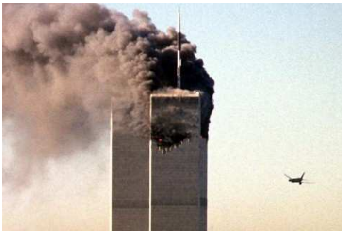
Am 11. September 2001 griffen islamistische Terroristen wichtige Symbole amerikanischer Macht an.