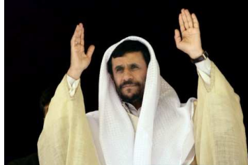
Besonderes Aufsehen erregte Ahmadinedschad mit der Leugnung des Holocausts.