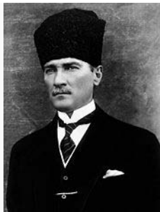
Gazi Mustafa Kemal Atatürk

Das Islamgesetz gilt in Österreich auch nach dem Ersten Weltkrieg weiter. Mit Wirkung vom 24. März 1988 wurde im Islamgesetz die Wortfolge „nach hanafitischem Ritus“ in Artikel 1 und in den Paragraphen 5 und 6 als verfassungswidrig aufgehoben und die Geltung des Gesetzes somit auf alle Muslime erweitert. Das Gesetz heißt seitdem im Langtitel „Gesetz vom 15. Juli 1912 , betreffend die Anerkennung der Anhänger des Islams als Religionsgesellschaft“ (vgl. BGBl. Nr. 164/1988).